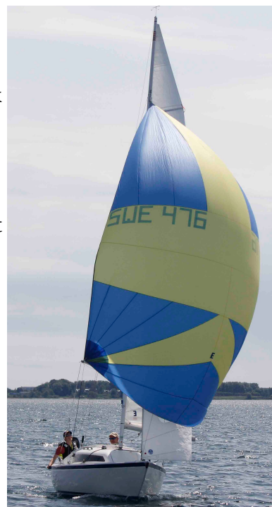
Snärtan i ledning.