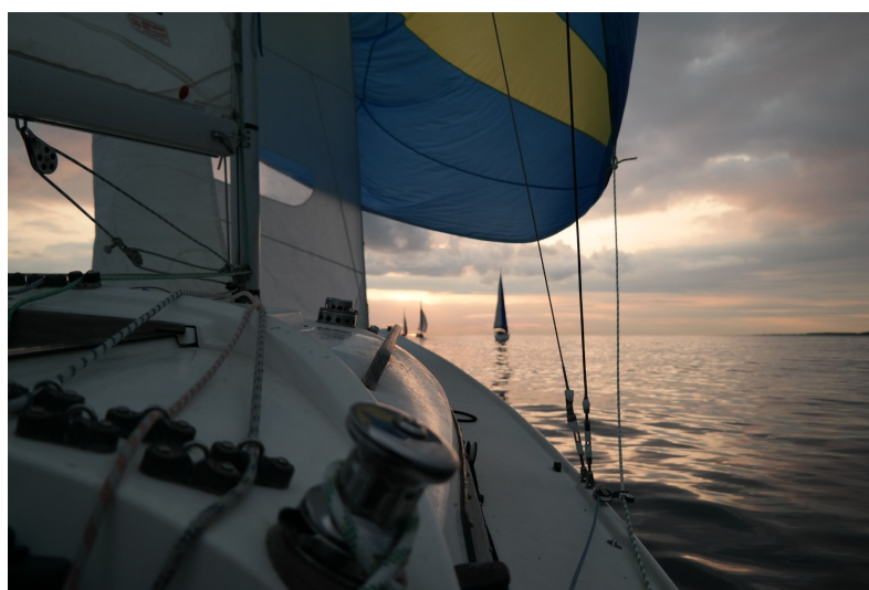
Svinbådan för över.

Vi fick vind och gick förbi Ven relativt snabbt. Vinden tilltog inte nämnvärt, men vred sig för att övergå till kryss. Runt Helsingborgshamn lopp snurrade vindarna och det var inte många meter vi vann på kryssen. Plötsligt vände vinden igen och vi fick en läns mot Svinbådan. Vinden fyllde knappt spinnakern och mestadels av farten över grund kom av strömmen.